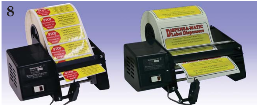
9. Dispensa-Matic "6-II" "10-II" "16-II" - pour les étiquettes en rouleaux ou en paravent d'une largeur de 14 cm, 24 cm, 39 cm ou moins. Étiqueteuse économique à chargement ULTRA rapide. Idéale pour les rouleaux de grand diamètre nécessitant une vitesse régulière (progression de 15,2 cm).

La machine Bottle-Matic est idéale pour l'étiquetage de vos objets cylindriques. Notre machine étiquette vos bouteilles, conserves, tubes et bocaux par le biais d'un simple interrupteur à pédale. Elle peut même prendre en charge les objets coniques ! Même si votre conserve ou votre bouteille est striée, nous pouvons adapter les rouleaux. La personnalisation de votre Bottle-Matic est facturée à l'heure. Si nous ne parvenons pas à la faire fonctionner, vous n'avez RIEN à payer ! Il vous suffit d'envoyer l'objet à étiqueter, ainsi qu'un rouleau des étiquettes à apposer.